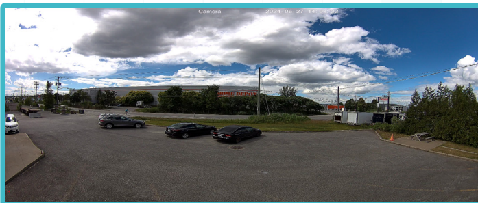
XB7FPAN28IP8MP-AI VUE PANORAMIQUE 180°