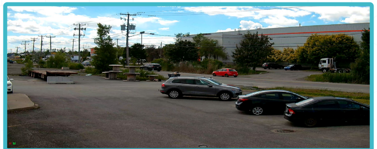
AUTRE CAMÉRA GSD AVEC LENTILLE DE 2.8MM